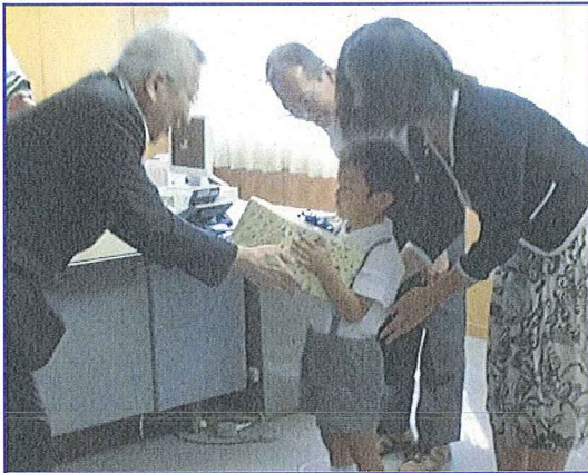
井関松山製造所 戸田社長より代表園児へ贈呈

「三世代交流型交通安全教室～孫心プレゼント～」に活用する『反射材キーホルダー』を松山市の3幼稚園に贈呈しました。 これは、園児が自分の顔写真を入れて、まごころ込めて手作りした反射材キーホルダーを祖父母にプレゼントし、身につけていただくことで夜間の高齢者交通事故防止に取り組むものです。 贈呈式を、9月17日(水)松山西警察署内で行いました。