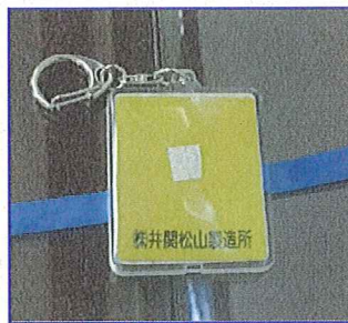
300個贈呈した反射材付きキーホルダー

平成26年9月19日付 愛媛新聞に掲載 (掲載許可番号G20141001-01709)